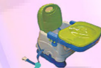
固定帶，此座椅可單獨使用，或將固定帶固定於一般餐椅上當做高腳椅！