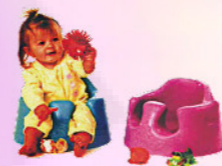
www.epii.com.tw/ 嬰兒擺位椅：提供符合身體輪廓的骨盆、下背支撐！