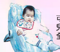
可攜型嬰兒汽車安全座椅

嬰幼兒無法採用直立坐姿時，早期可使用可攜型嬰兒汽車安全座椅來作為餵食座椅，嬰幼兒稍長，仍需餵食且頭頸軀幹仍需大量支撐，可考慮餵食椅或特製高腳椅，提供良好坐姿支撐！