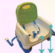
www.sto-form.com/ 兒童餐椅：分隔突起與弧形接觸側面提供穩定座面。